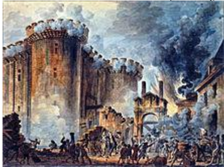
Η Άλωση της Βαστίλλης.

ΑΝΤΙΔΡΑΣΗ ΛΑΟΥ: 14 Ιουλίου 1789 κατέλαβε τη Βαστίλλη, σύμβολο απολυταρχικής καταπίεσης.. Η εξέγερση μεταδόθηκε και στις επαρχίες, όπου καταλύθηκαν οι δημοτικές αρχές (οργανώθηκαν νέες) οργανώθηκε εθνοφυλακή, λεηλατήθηκαν πύργοι ευγενών.