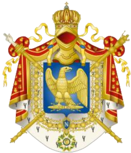
Ο θυρεός της Α' Γαλλικής Αυτοκρατορίας, υπό τον Ναπολέοντα Α'.